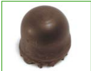
1 Schokokuss 28 g: 98 kcal