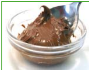
1 TL Nuss-Nougat Creme 10 g: 42 kcal