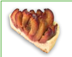
1 Stück Obstkuchen 100 g: 162 kcal