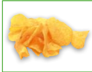
1 Portion Chips 25 g: 134 kcal