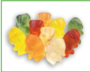
10 Gummibärchen 20 g: 40 kcal

Energiegehalte verschiedener Süßigkeiten und Knabberereien: