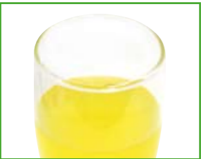
1 Glas Limonade 0,2 l: 83 kcal