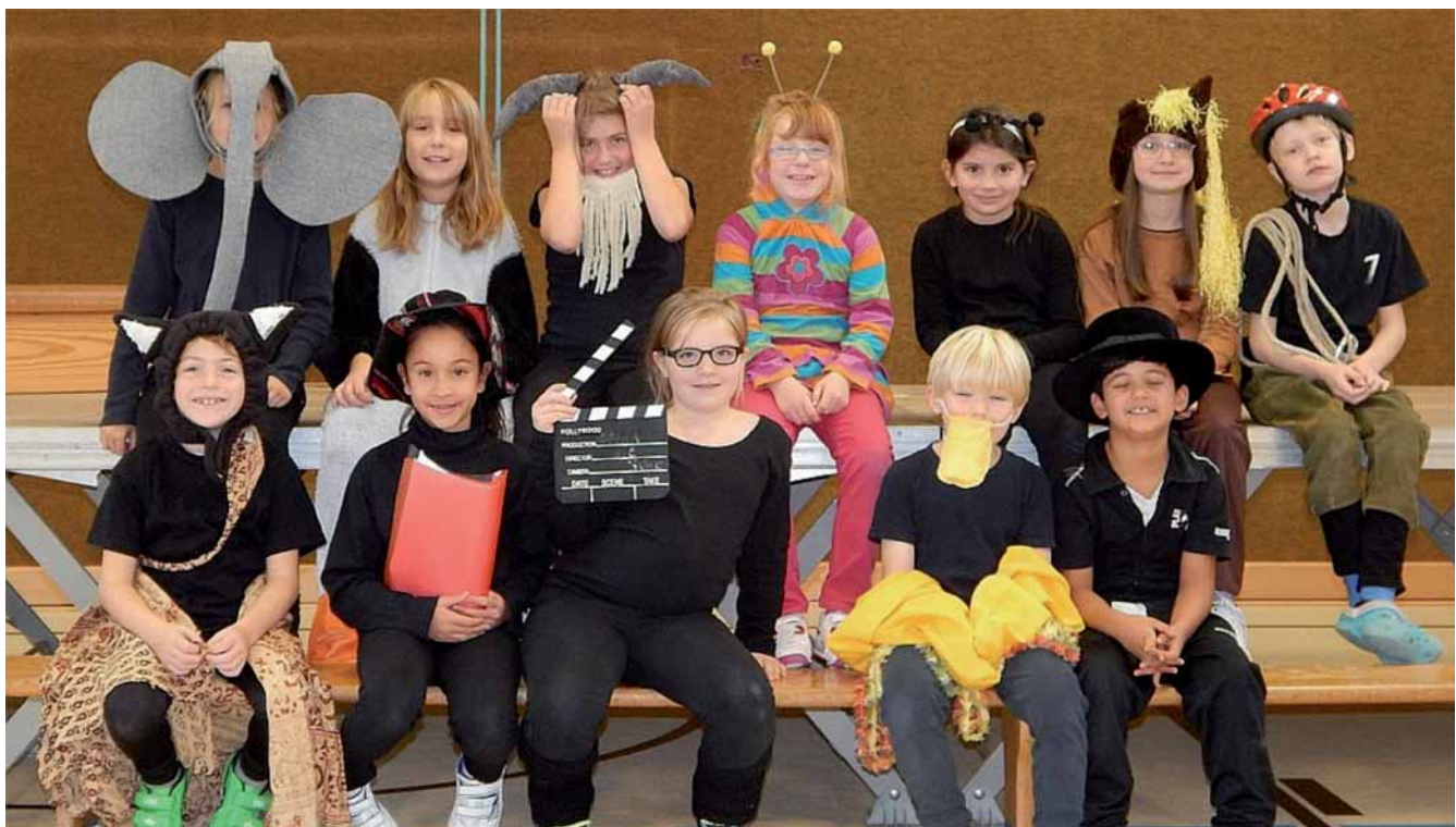
„Wenn die Ziege schwimmen lernt“ – ein Theaterstück über Stärken und Schwächen

Die Aufführung des Theaterstückes „Wenn die Ziege schwimmen lernt“ auf der Grundlage des gleichnamigen Bilderbuchs